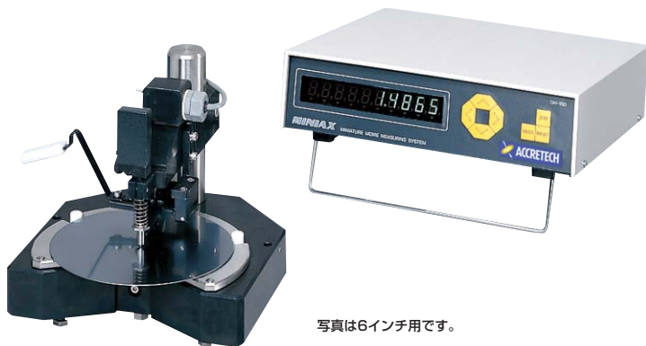
写真は6インチ用です。